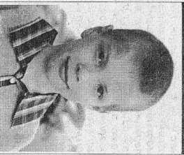
Иду маму и папу

Уровень рождаемости в Красноярском крае снизился до уровня конца 2000 года. По оперативным данным, рождаемость в крае составила 2,87% от экономически активного населения. При этом темпы рождаемости в крае снижались на протяжении последних нескольких лет.