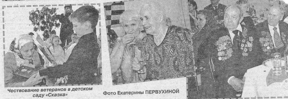
Чествование ветеранов в детском саду «Сказка»