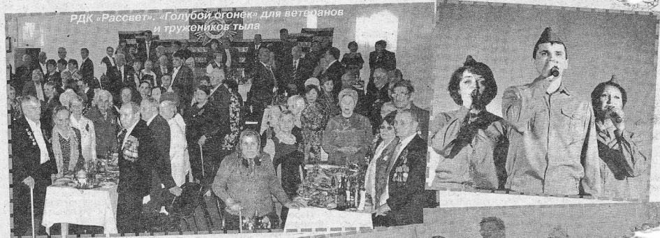
РДК «Рассвет», «Голубой огонек» для ветеранов и тружеников тыла