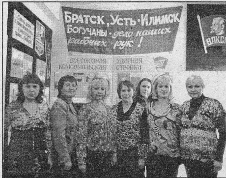
фессионализм в своем деле, тепло сердец и сибирское радушие.

Хорошая традиция сложилась у педагогов ДОУ «Сибирячок»: каждой весной творческая группа «Ангарочка» ходит на экскурсию в районный музей. Темы экскурсий меняются, а желание прийти в музей остается. Педагогическое сообщество «Ангарочка» объединено одной целью - воспитать у дошкольников чувство патриотизма к семье, городу, району, а стало быть, и к нашей Родине. В план работы этой группы входит регулярное посещение музея педагогами, детьми и родителями.