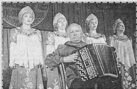
Хор учителей из Кодинска

так назывался районный фестиваль, который прошел 26 февраля в РДК «Рассвет». Он был посвящен грядущему юбилею Победы