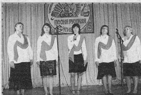
Поет вокальная группа из Недокуры