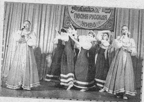
Выступление коллектива РДК «Рассвет»