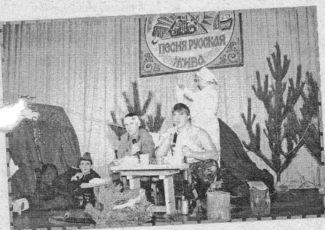
Театрализация «Весна-1945 года». Имбинский СДК