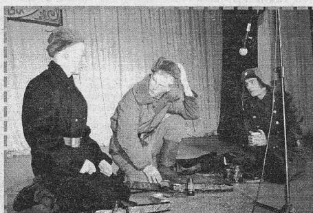
Композиция «На привале». Ярковский СДК