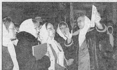
Церковный хор - украшение любого православного праздника в Козинске

ет проводить занятия сторонних коллективов, так как уроки заканчиваются не ранее 20.30 вечера (это подтверждается расписанием школы!». 3. Присутствие посторонних коллективов в школе приводит к изменению режима работы административного и обслуживающего персонала школы!». 4. Увеличится оплата коммунальных услуг (вода, электроэнергия)». Так расчерком чиновничьего пера церковный хор, который с 2002 года занимался в вечернее время в помещении ДМШ (и весь этот период для него почему-то находилось и место, и время, и возможности для оплаты коммунальных и прочих услуг!) и оказался бы в одиночестве на улице, если бы не Управление образования района (Н. М. Журавлева), которое смогло изыскать возможности для его занятий на базе общеобразовательных школ города. Выходит, если захотим, всё можем решить. Нужны лишь желание помочь детям и добрая воля ответственных руководителей. Думаем, после вывода церковного хора за пределы ДМШ и без того богатый районный бюджет богаче не станет! Наш хорр.