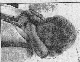
Подготовила Екатерина ПЕРВУХИНА

- После насыщенной и волнующей программы и впечатляющих каникул своей с маме Старица, готовила, убирала, пладила. Понять, что погуляешь в домашних богах и проблемах. Для нас год ансамбля «Эдусейк» напечатанной тол-обойнички нам будет отмечать десятку толошину его создания. И эти дни я в спокойной обстановке смогла поджарить, как лучше провесте. Обильное мероприятие.