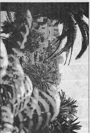
Вид на Акрополь сквозь пальмы.

Вечером, вернувшись в номер, напанино укладывает сумки. За день проехав 13 километров.