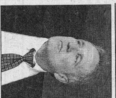
Стр. 11, 14.