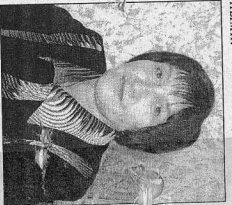
Подсказка Титилина ИКУТНА.

Жены и дети знают особенности нашей работы и поэтому всегда стараются помогать и поддерживать нас. Длительного новогоднего праздника у нас не бывает. Всегда другие - многие наши сотрудники стараются честно выполнять свой служебный долг, приносить пользу обществу.