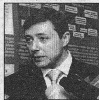
А. Г. ХЛОПОНИН, губернатор края.