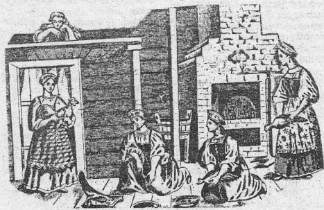
Страницу подготовила Галина БАРАНОВСКАЯ.

А еще угощения должны быть необычными - по виду, по вкусу и по аромату.