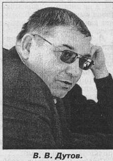
В. В. Дутов.