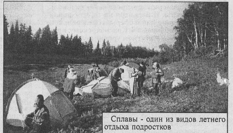
Сплавы - один из видов летнего отдыха подростков