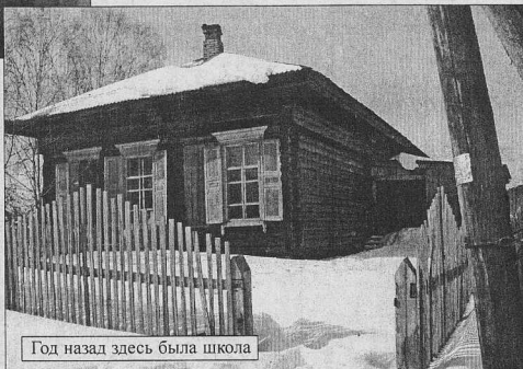
Год назад здесь была школа

ИЗ ГОДА В ГОД мне приходится наблюдать, как деревня разрушается, как ее покидают оставшие ждать лучшей доли жители. Еще два года назад здесь была начальная школа, которая поражала своим нищенским существованием, но все же 5 ребятшек получали в ней начальное образование. Был тогда и магазин, где в изобилии продавали лишь спиртное. Сегодня школа закрыта - учить некого. Нет и магазина. Правда, торговля спиртным (самогоном) не прекратилась. Пожалуй, это единственное дело, которое еще процветает в Бидее.