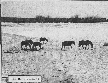
Чьи вы, лошади?