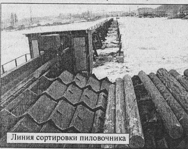
Линия сортировки пиловочника

Пиломатериалы с КОДОКА доставляются на станцию «Новохауская», а затем через тупик кодинской перевалочной базы производится их отгрузка и доставка в порт Находка. Готовая продукция реализуется в Японию через фирму «Хонда». КОДОК работал с этой фирмой еще раньше, на поставках круглого леса.