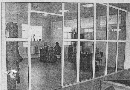
В офисе предприятия

Итак, КОДОК проработал шесть месяцев. Можно подводить первые итоги.