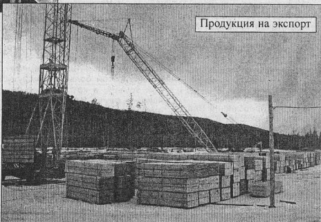
Продукция на экспорт

Валентина БУТАКОВА.