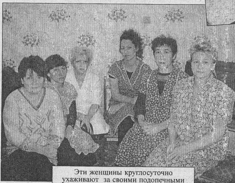
Эти женщины круглосуточно ухаживают за своими подопечными

Валентина БУТАКОВА