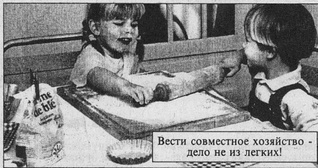
Вести совместное хозяйство - дело не из легких!

финансовую зависимость. По действующему трудовому законодательству право на трудоустройство имеют граждане, достигшие возраста 16 лет, в некоторых случаях в возрасте 15 лет. Однако с согласия одного из родителей трудоустроиться может 14-летний гражданин для выполнения «легкого» труда и иметь соответственно пропорциональный труду заработок.