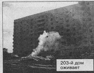
203-й дом обживает

тах-строителях. Для любой организации жизненно важно вовремя выплачивать зарплату, и тогда люди будут держаться за свои рабочие места. Сегодня с уверенностью можно сказать, что у нашего предприятия есть будущее, да и конкурентов нет, и наверняка не будет. В последние годы нас только систематически переименовывали, но в конечном результате мы выстояли, выжили, и это уже важно.