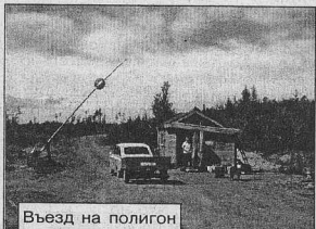
Въезд на полигон

Записала Галина БАРАНОВСКАЯ.