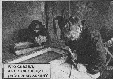
Кто сказал, что стекольщик - работа мужская?

- Я чувствую себя хорошо. Работа интересная, и мы сможем в скором времени встать на ноги, даже не смотря на то, что наш город испытывает большие трудности в специали-