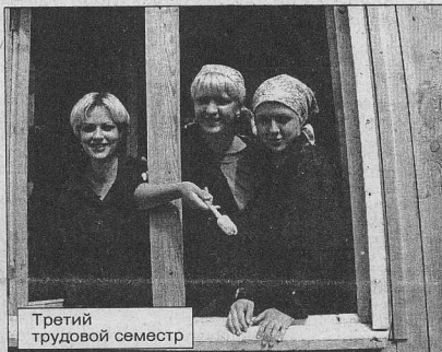
Третий трудовой семестр