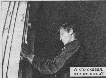
А кто сказал, что женская?

себя уверенней, и я думаю, что и мы сможем в скором времени встать на ноги, даже не смотря на то, что наш город испытывает большие трудности в специали-