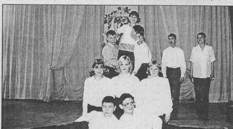
«Пирамиды власти» заледеевцев