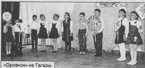
«Орленок» из Тагары

В желтых галстуках, с желтым флагом (цвет солнца) вышли на сцену ребята из КСОШ № 3. Их республика мальчишек и девчонок пятых - девятых классов уже давно сформировалась, имеет четкое устройство: каждый класс - город, где есть свой мор;