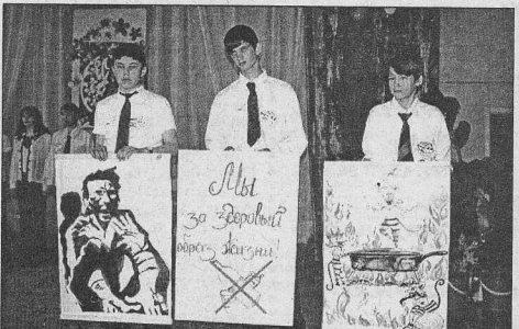
Фрагмент выступления агитбригады Имбинской школы