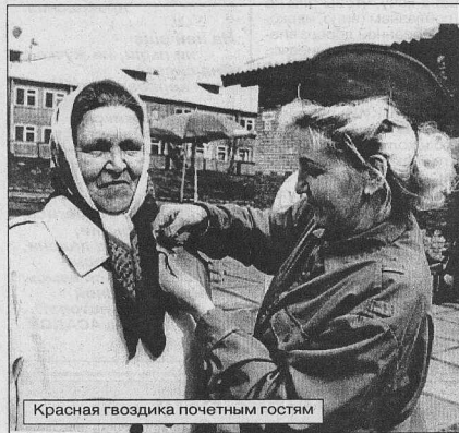
Красная гвоздика почетным гостям

латить нашему народу. Вот и на митинге, видя, что слезы смахивают не только ветераны, не только люди среднего поколения, но и школьники-старшеклассники, я гордилась своим народом, не утратившим способности помнить и сострадать. Мне показалось, что самой щемящей нотой митинга стала песня в исполнении Людмилы Алексеевны Филипповой: «Какой бы мы красивой были парой, мой милый, если б не было войны...»