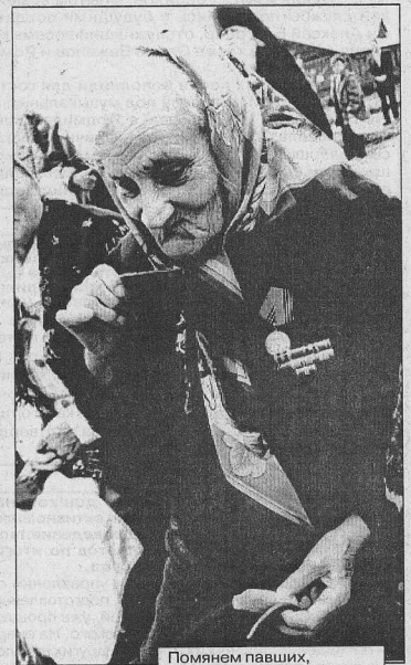
Помыям павших, выпьем за здравие живых

На снимках: празднование Дня Победы в г. Козинске.