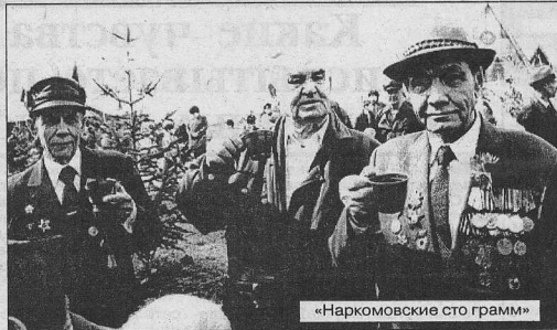
«Наркомовские сто грамм»