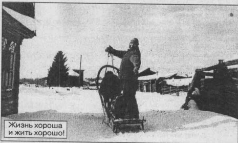
Жизнь хороша и жить хорошо!