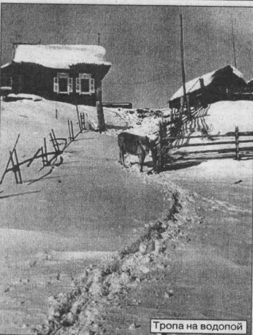
Тропа на водопад