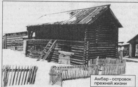
Амбар - островок прежней жизни

Тишина. Поразительная для человека, живущего даже в таком небольшом городке, как Кодинск.