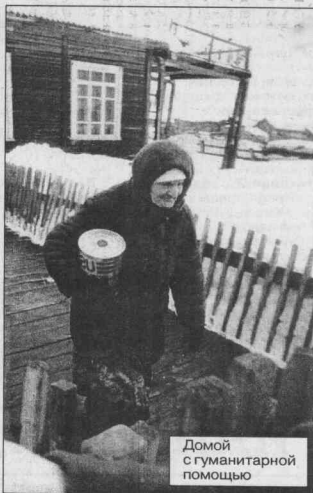
Домой с гуманитарной помощью

На сход в еще крепком, добротном клубе (на входе в зрительный зал хорошо сохранившийся лозунг семидесятых - «Превратим Сибирь в край высокой культуры!») людей пришло немного. Нас, приехавших из Кодинска, было значительно