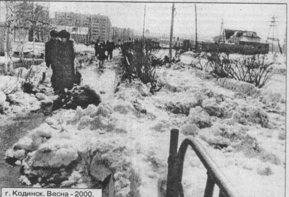
г. Козинск. Весна - 2000.

А может быть, нас ждет приятный сюрприз, и в ближайшие дни город будет очищен от снега? Честно говоря, верится в это с трудом. Если раньше в городе еще можно было увидеть снегоборочные машины, то, похоже, в этом году КМУП ЖХХ решило не заниматься этим делом вовсе. Или оно сейчас копиет силы для решающей битвы за город?