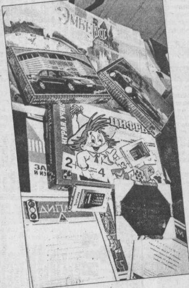
Вот такие призы получили наши ребята.

Задач у конкурса было немало. Здесь и изучение подростками Правил дорожного движения, и выработка на-