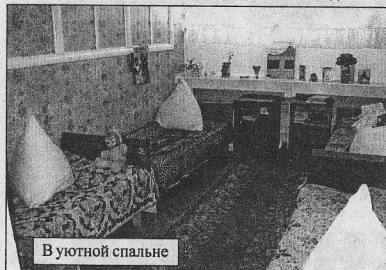
В уютной спальне