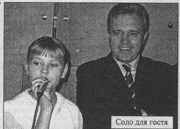
Солю для гостя