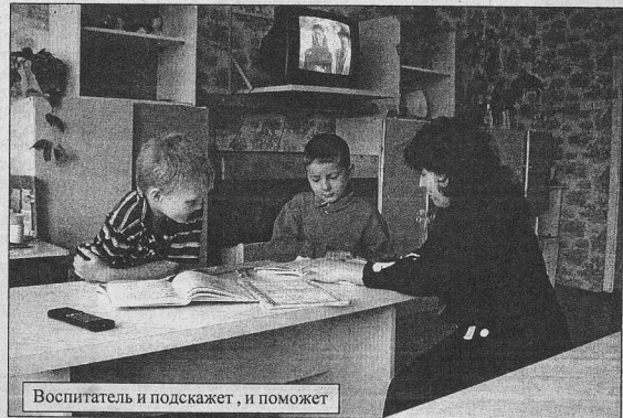
Воспитатель и подкажет, и поможет