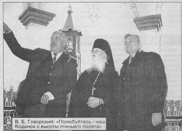
В. Е. Говорский: «Полубуйтесь - наш Кодинск с высоты птичьего полета»