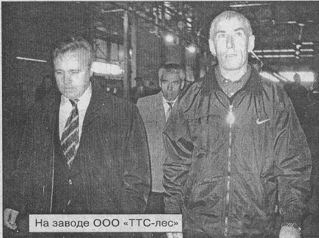
На заводе ООО «ТТС-лес»