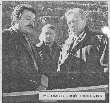
На смотровой площадке

болезненный для строителей (Окончание на 6-й стр.)