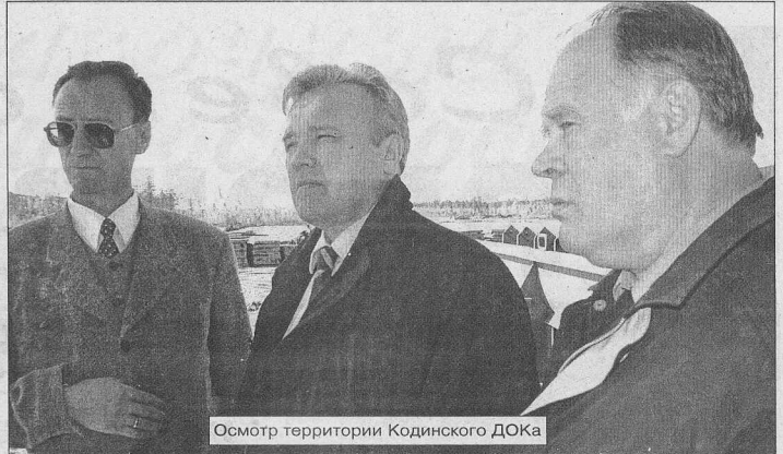
Осмотр территории Кодинского ДОКа