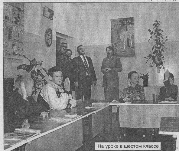
На уроке в шестом классе