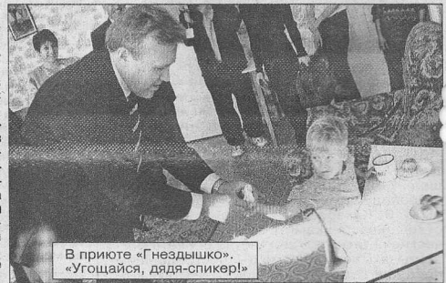
В приюте «Гнездышко». «Угощайся, дядя-спикер!»