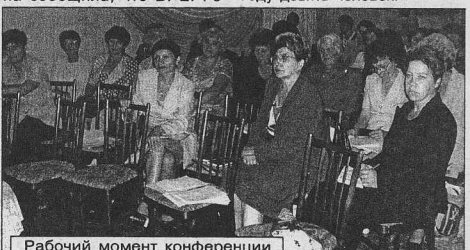
Рабочий момент конференции