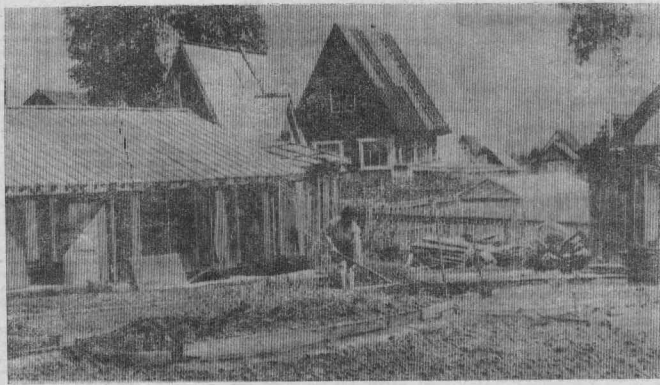
ДАЧНЫЙ СЕЗОН В РАЗГАРЕ.

КВАС СВЕКОЛЬНЫЙ. Вареную свеклу нарезать небольшими кусочками или натереть на крупной терке, залить кипятком и оставить в теплом месте на 1—2 часа. Охладить, опустить в отвар мерелвые мешочки с кусочками ржаного хлеба и оставить на сутки для брожения. После этого хлеб убрать, а квас использовать как напиток.