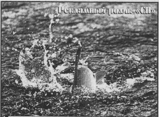
«СП» в потоке информации Как быстрый хариус в реке. Всегда узнает и расскажет: Кто, почему, зачем и где!

И ещё я думаю: а разве в бытность СССР русские люди не были независимы? Выходит, что не были, раз такой праздник придумали.