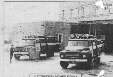
«Готовность номер один».