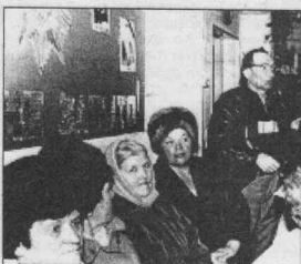
Во время схода.

последствиями страшного стихийного бедствия. Что думал этот человек, поджигая с нескольких сторон здание? Кому он мстил? Что хотел доказать? В чём провинились перед ним недокурские ребята, в одночасье лишившись прекрасной библиотеки и от е к и (12599 книг)? Мы никогда не узнаем ответа на эти вопросы, как, скорее всего, никогда не узнаем имя поджигателя, человека с выгоревшей, чёрной душой.