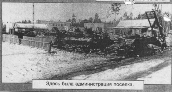
Здесь была администрация посёлка.

рабатывающее предприятие, финансируемые учреждения бюджетной сферы - все эти факторы играют положительную роль и обеспечивают недокурам нормальную жизнь (особенно если сравнивать с д. Усолицево).