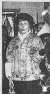
Вопрос от безработных.

рабатывающее предприятие, финансируемые учреждения бюджетной сферы - все эти факторы играют положительную роль и обеспечивают недокурам нормальную жизнь (особенно если сравнивать с д. Усолицево).