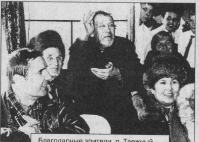
Благодарные зрители, п. Таежный.