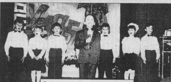
Вокальная группа 1 класса. Пос. Недоура.