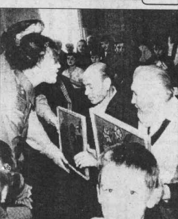
Кежма. Подарки ветеранам.

Как я уже сказала, все певческие выступления таёжничков были сильными, но когда в финале концерта зазвучал сводный хор