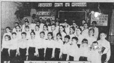
Сводный хор. Пос. Таежный.