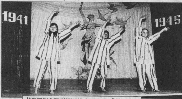
Музыкально-танцевальная композиция «Саласпилс».

В ФЕВРАЛЕ «Московский комсомолец» опубликовал «круглый стол» с иностранными журналистами, долгие годы работающими в России. Разговор шел о новейшей истории нашей страны, о взгляде мирового сообщества на ситуацию, сложившуюся на 1/6 части земной суши после распада Союза.