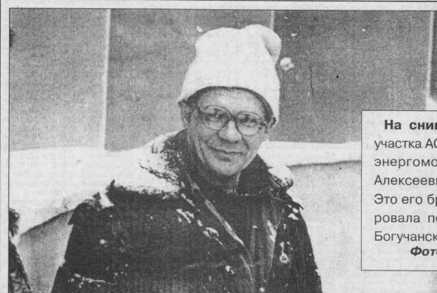
Доска почета «СШ»

Страна Любви - великая страна! И с рыцарей своих для испытаний Всё строже станёт спрашивать она: Потребуется разлук и расстояний, Лишит покая, отдышка и сна... Но воплять безумцев не вернут Они уже согласны заплатить - Любви ценой - и жизнью бы рискнули, Чтобы не дать погварь, чтоб сохранить Волшебную невидимую нить, Которую меж ними протянули. Но многих захлебнувшихся любовью Не докричались - скляки ни зови, Им счёт ведут молва и пустословье, Но этот счёт замешан на крови. А мы поставим свечи в изголовье Погибших от невиданной любви... И душам их дано бродить в цветах, Их голосам дано сливаться в такт И вечношю дышать в одно дыханье, И встретиться в со вздохом на устах - На хрупких переправках и мостах, На узких перекрётках мироздания Свежий ветер избранных пьянил, С ног сбивал, из мёртвых воскресал, потому что если не любил - Значит, и не жил, и не дышал!