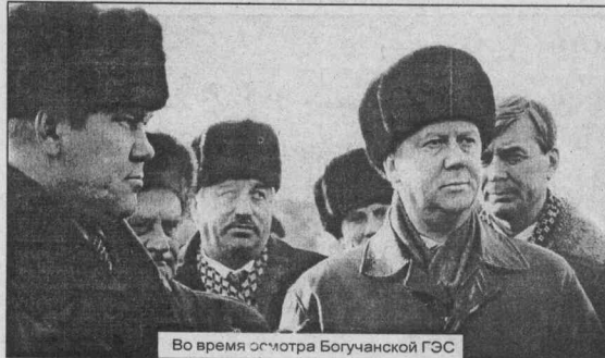
Во время осмотра Богучанской ГЭС

Его помощники высказали предположение, что деньги можно найти внутри энергосис-