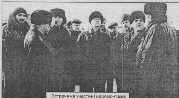
Встреча на участке Гидромонтажа