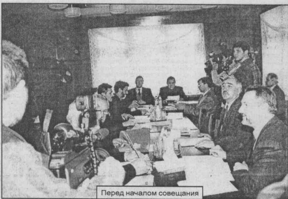
Перед началом совещания