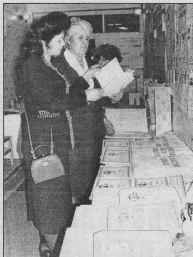
(Продолжение. Начало в № 127-128, 130-131, 133-134, 136-137.)