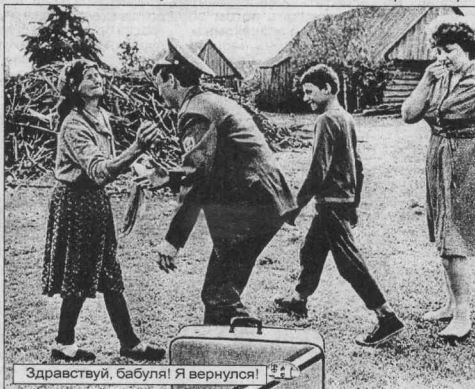
Здравствуй, бабуля! Я вернулся!

Так что, у кого девичья жизнь «Жить - значит наслаждаться», не терять своей свободы. Хотя, у каждого своя голова на плечах.