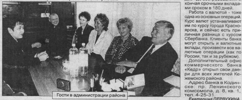
Гости в администрации района