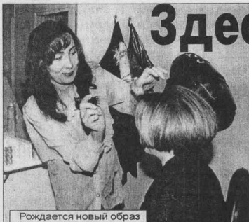
Рождается новый образ

Ч ТО ДЛЯ ЖЕНЩИНЫ во все времена являлось предметом больших хлопот и одновременно любимым занятием? Конечно же, собственная красота. Порой представительницы прекрасного пола из-за сложившегося нога или стрелки на новых колготках переживают больше, чем из-за сгоревшего ужина или ссоры с любимым. А из всех искусств наводит краску у главнейшим для женщин является создание прически. Уважающая себя дама никогда не выйдет в люди лохмотной. Прическа — это «лицо» каждой женщины. Поэтому честолюбивая она с волосами не делает красит их, мелирует, завивает, мажет гелем, брызгает лаком, стрижет, начесывает... Всего не перечислить.