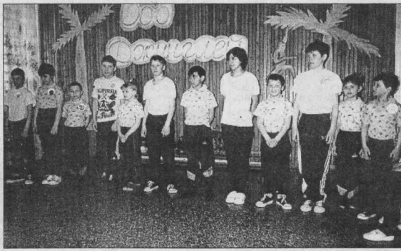
Фото из семейного альбома приюта.