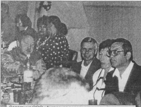
Делегация ООО «Ангарская лесопромышленная компания»