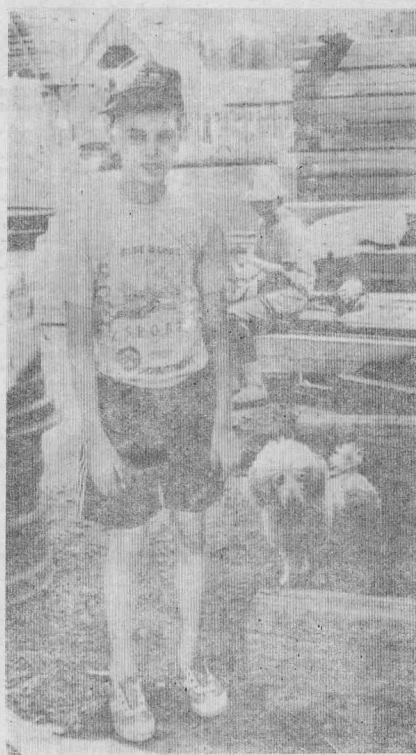
МЫ С ДРУГОМ НА ДАЧЕ.