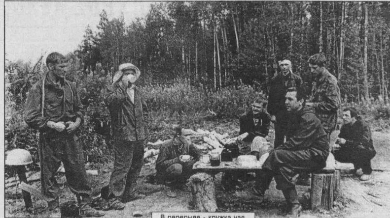
В перерыве - кружка чая.

Мне прекратили платить пособие по безработице в связи с окончанием установленного законом периода его выплаты. Через какое время я вновь могу быть признан безработным и получать это пособие?