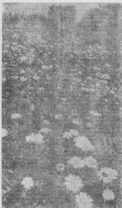
ОНИ ПОКА ЕЩЕ ЦВЕТУТ...

1 кг долек ревеня, 100 г апельсиновых корок, 1,2-1,3 кг сахара.