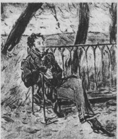
Луккула», доставившая поэту больше неприятности. В наследнике богаты, ворушащего казенные деньги, все узнали министра просвещения Уварова. Тот обратился с жалобой к царю. И Пушкин получил страшнейший выговор.

В августе 1836 г. цензура (министр Уваров) запретила печатать его статью «Александр Радищев». Тут же начались нападки на его стихотворение «Памятник», как на самовосхваление. А это был ответ на несправедливую критику всевозможных ниспровергателей Пушкина, это размышление о роли и заслугах поэта и обращение не к своему времени, а к будущим поколениям, которые сумеют оценить его. Но Жуковский поспешил и постыдно стал исправлять, «облагораживать» это стихотворение.