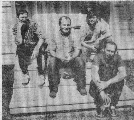
РЕБЯТАМ ЗДЕСЬ НРАВИТСЯ

В лагерь отдыха «Огонек», что расположен на берегу Ангары неподалеку от д. Сыромолотово, мы приехали утром 21 июня. Именно в этот день здесь должно было состояться торжественное открытие нового летнего сезона.