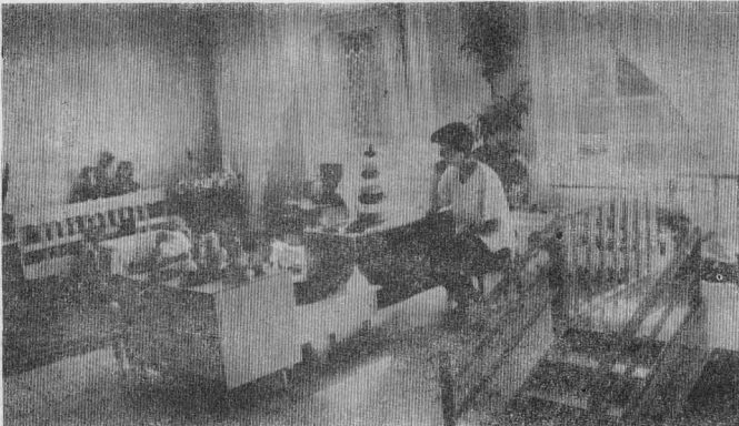
ПУСТЫННО В ГРУППАХ...