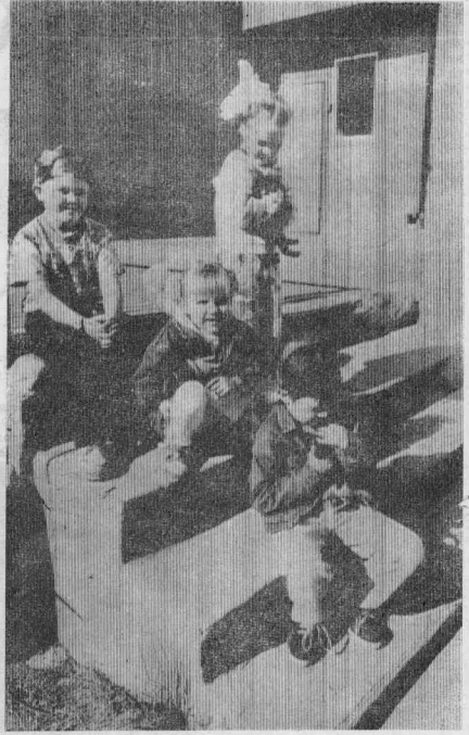
ИГРАЕМ НА КРЫЛЬЦЕ.

— За здание они не должны, так как идут в переплате в сумме 168850 рублей. В 1997 году был использован завышенный тариф по химводочистке, и они потребовали возврата денег, потому как мы им переначислили. Вот эта сумма и является до сих пор (была порядка миллиона), поскольку