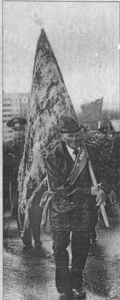
Все меньше нас идет с людским потоком, Настанет час - последний упадет. Но слава наших дней принадлежит потомкам. Она, как наш народ, вовеки не умрет.