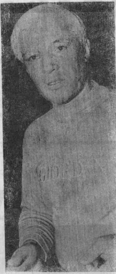
«Кеттлера», которые очень помогли при подготовке сборной команды. Помогает нам РУНО и лампами дневного освещения, в которых мы остро нуждаемся. Но этого явно недостаточно, так как качественных столов, подобных тем, на которых приходится играть на соревнованиях высокого ранга, нам не хватает.

И последней проблемой я бы назвал недостаток спортинвентаря и не удовлетворительное место для тренировок. Уже длительное время нам не выделяется средств, и поэтому покупать теннисные мячи и ракетки детям приходится за свои деньги. В прошедшем году управление народного образования приобрело нам два стола фирмы