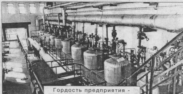
Гордость предприятия - центральная котельная.

Кодинскому РЭС нет десяти лет, это еще очень молодая служба. Но сегодня уже можно с уверенностью сказать, что эта служба занимает достойное место в большом коллективе «Северо-Восточных электрических сетей».