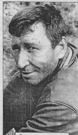
В минуты отдыха.

ДАВАЙТЕ с вами, уважаемые читатели, на несколько мгновений перенесемся в небольшую поселок или деревенку, что спрятались в глухой тайге, вдалеке от оживленных транспортных магистралей и больших городов - оплотов цивилизации. Тот, кто хоть раз бывал в подобном поселке или деревне, просто не мог не заметить громкого и надежного тараканья мощного дизельного двигателя электростанции, благодаря которой весь населенный пункт обеспечивается электроэнергией. Правда, зачастую это бывает по жестко ограниченному графику, а иногда вовсе несколько часов в сутки. Вот теперь-то и станет понятным, насколько значительным событием в жизни таких населенных пунктов становится приход в них линий электропередачи, позволяющих обеспечивать население светом и теплом, да и прочими благами цивилизации не по расписанию, а круглосуточно и бесперебойно.