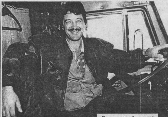
Перед дальней дорогой.