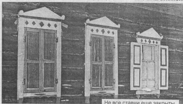
Не все ставни еще закрыты.