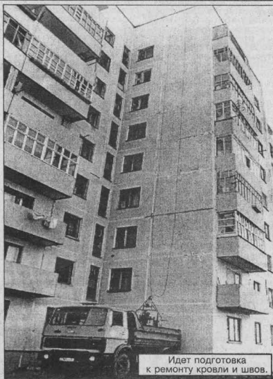
Идет подготовка к ремонту кровли и швов.

дымом, жители первых этажей возмущаются, а верхние и потеряли бы, они-то уж на все согласны, только чтобы на голову вода не лилась. Если бы у нас был гидропаркет, битумное хозяйство, то мы бы смогли производить работы, не нанося вреда жильцам. Нет у нас и термосов, в которых могли бы возить разогретый битум. Да и масса других проблем возникает. - Вы параллельно ведете и ремонт наружных швов? - Да, в этом направлении также работаем, но для ПЖРЭО это дорогое удовольствие.