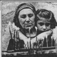
Угодя ты Богу, свеча восковая, Пред образом Божиим ты в храме горшишь...

Ч ТО ДЕЛАЕТ человек, пришедший в храм? В первую очередь он покупает и зажигает свечи. С маленькой церковной свечи и начинается приобщение человека к нашей Православной вере.