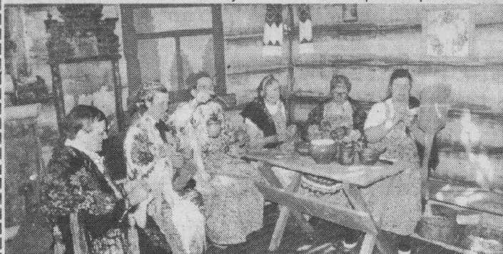
Фольклорная группа с. Паново.