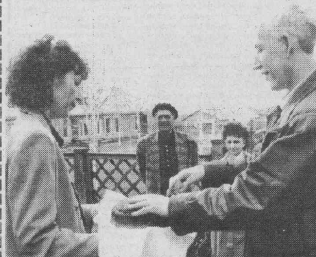
Хлеб-соль в п. Таежный.