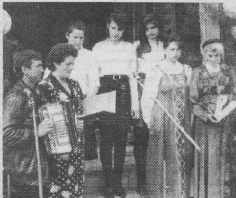
п. Болтурино. Во время концерта.