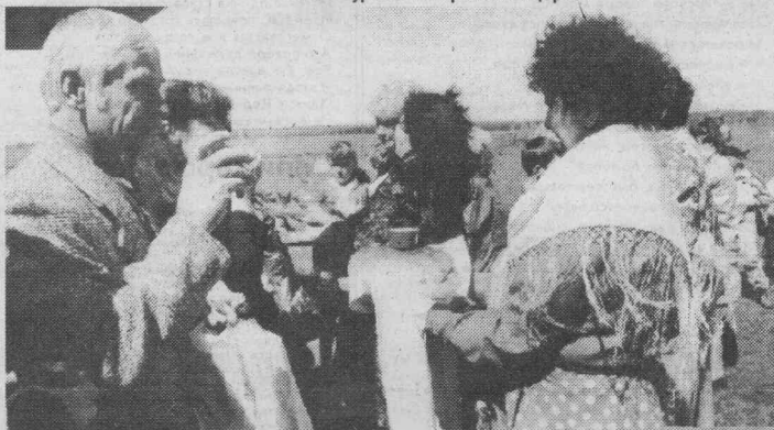
Яркино встречает самолет с гостями из Кодинска.