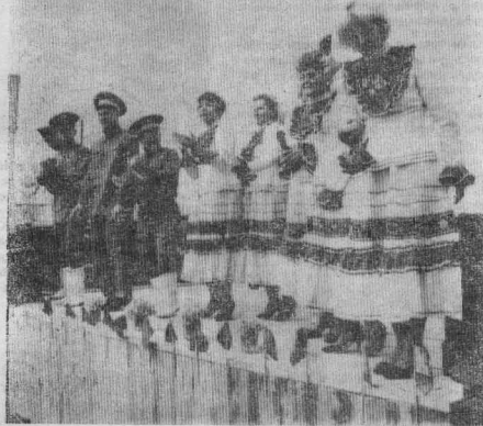
【Окончание. Начало в №№ 63, 64, 67】

В Кежму двумя самолетами были доставлены гости из Кудинска и творческий коллектив РДК «Рассвет». У трапа самолета по русскому обычаю гостей встречали хлебом-солью да веселой песней.