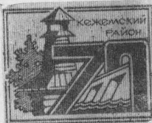
которая стала потом моей родной навеки Кежемской средней школы.

Помню, в школе ставилась скатина в лицах и диалогом, и меня изображали рыбакком с удильцем: я был отмычки и добывал уды, на которые сам же попадался. И меня в третьем классе изгнали в ШКМ, школу колхозной молодежи,