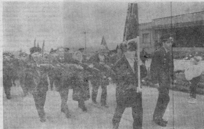
[Начало на 1-й стр.]

В этот день колонна ветеранов Великой Отечественной прошествовала от ДК «Рассвет» к мемориалу и возложила пихтовые веточки и букеты цветов.