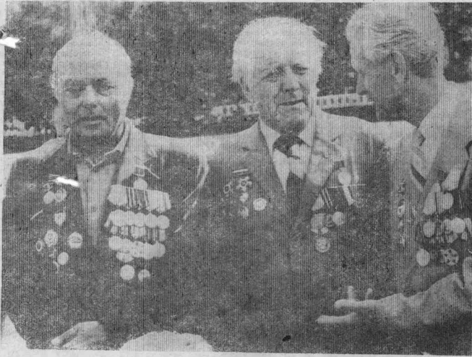
17 МАЯ — ВТОРОЙ ТУР ВЫБОРОВ ГУБЕРНАТОРА КРАЯ