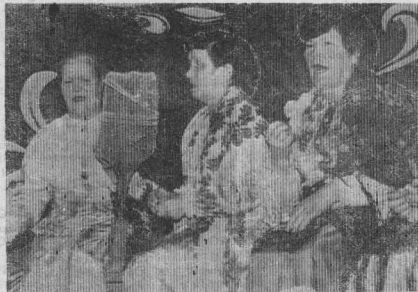
«ВЕЧЕРНИЕ ПОСИДЕЛКИ». КОЛЛЕКТИВ ИЗ П. НЕДОКУРА.