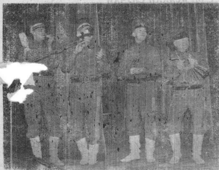
АНСАМБЛЬ «КАЗАКИ» РДК «РАССВЕТ».

«Песня несется, не зная конца, Плачет в очах, прожигая сердца, Бьется о стекла, летит к поднебесью... Слушайте песню, Слушайте песню!»